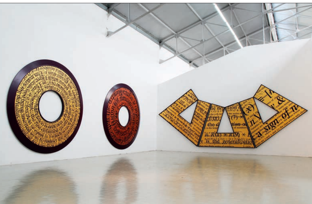
Ci-dessus, trois "Saturations" de Bernar Venet. Ci-contre, "Lamentable", de François Morellet (2006).