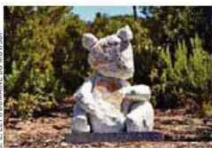
J.C. LETTIP/BOUMAÏNE DU MUY/SDP