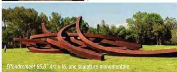
Effondrement 85.8 Arc x 16, une sculpture monumentale.

Car ce lieu a été pensé pour conserver et présenter de façon idéale l'essentiel du travail de Bernar Venet, mais aussi son exceptionnelle collection. Une centaine de pièces d'autres géants de l'art conceptuel et minimal ou du nouveau réalisme, qui ont eu