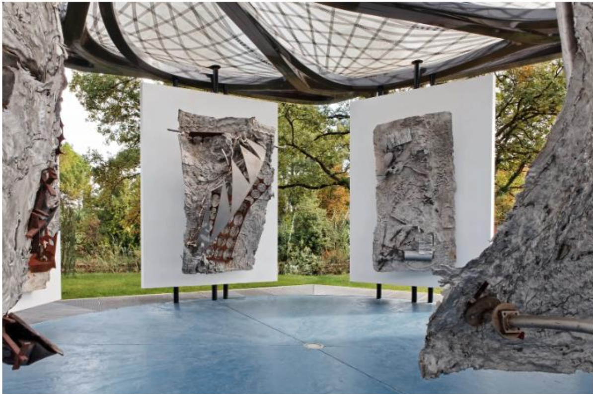
Chapelle Stella construite en juin 2014.