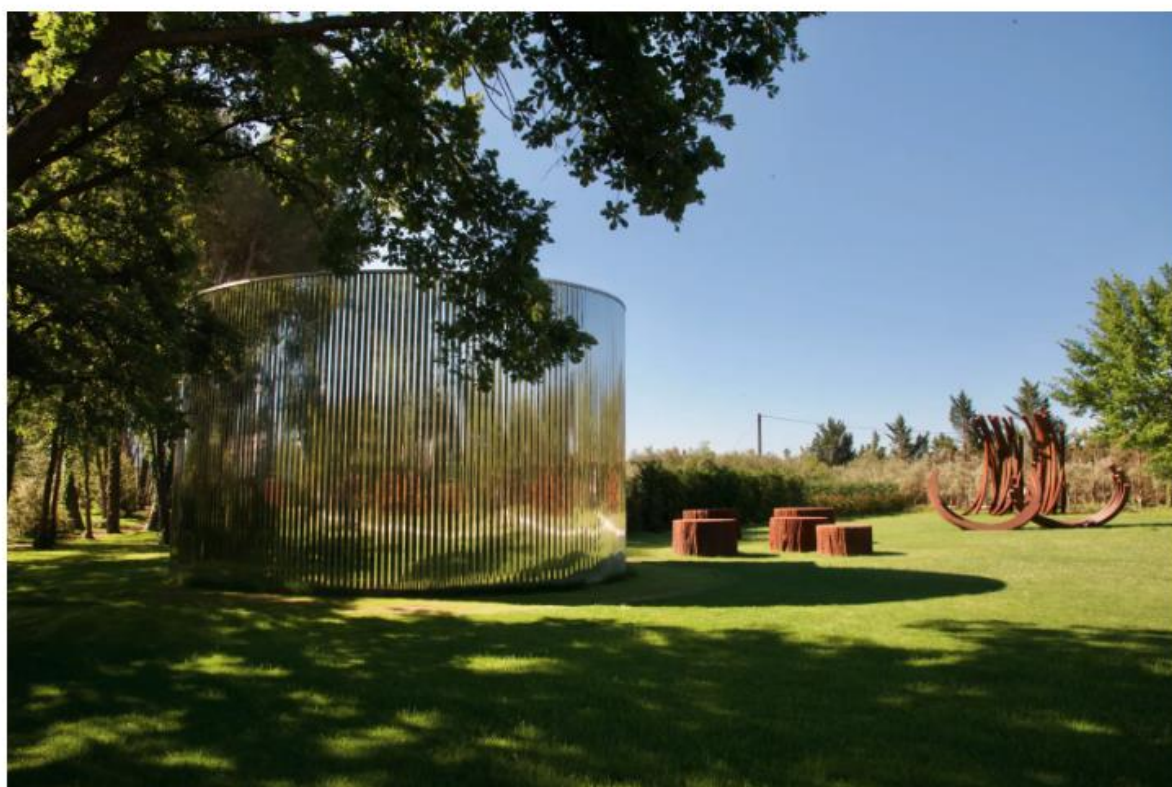
James Turrell, Elliptic Ecliptic.

« Souvent, le Domaine du Muy est décrit comme un havre de paix, mais c'est tout sauf un havre de paix, c'est un endroit vivant en perpétuelle évolution », martèle Bernar Venet. Âgé de 81 ans, le sculpteur Bernar Venet bouillonne d'énergie et de projets. Une effervescence qui l'anime dès ses débuts, le poussant à s'envoler pour New York en 1966, alors à peine âgé de 25 ans, sur les conseils de son ami, l'artiste Arman. Il y découvre les œuvres des minimalistes américains Donald Judd, Sol LeWitt, Carl Andre ou encore Dan Flavin, qui vont durablement l'influencer et qu'il aura à cœur de faire connaître. Le voilà lancé à New York, son port d'attache pendant près de quarante ans.