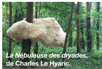
La Nébuleuse des dryades, de Charles Le Hyaric.

Pour sa 2 e édition, la Biennale internationale de Saint-Paul-de-Vence, fait la part belle à 18 jeunes artistes émergents et de toutes nationalités. Un parcours ponctué d'œuvres qui questionnent l'art et notre monde en quête de sens riche en temps forts, conférences,